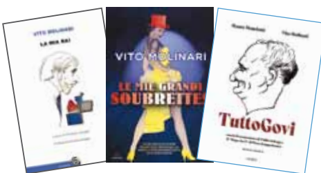
Alcune delle 2000 trasmissioni dirette da Molinari e 3 dei libri che ha scritto; Molinari durante l'intervista nella sua casa a Chiavari e la targa posta sul palazzo in cui è nato a Sestri Levante

l'ho scritturato per i primi videobox (gli antenati dei video musicali), poi per fare la soubrette con Macario e con tanti altri in teatro e in televisione. Al massimo della carriera ha avuto un incidente domestico assurdo: mentre faceva la doccia le è caduto addosso il boiler ed è rimasta paralizzato. Una carriera stroncata così, per una fatalità. Ancora oggi ha una gioia di vivere incredibile. Poi sono stato molto amico di Paolo Poli che ho diretto nel varietà "Babau" (1976). Era intelligente e ironico: ricordo una volta che gli hanno portato un mazzo di fiori bellissimo e lui 'Sempre fiori, mai un fiorista!'. Il fatto di essere omosessuale dichiarato gli ha bloccato la carriera. Mi viene in mente anche Antonio Ricci, che si è fermato a Striscia la notizia ma saprebbe fare molto di più".