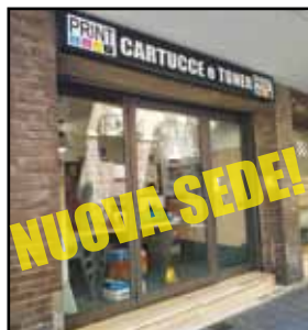
Print Shop Stampanti, cartucce, toner e riparazioni PC Chiavari Via Magenta 36 Tel 0185.324000