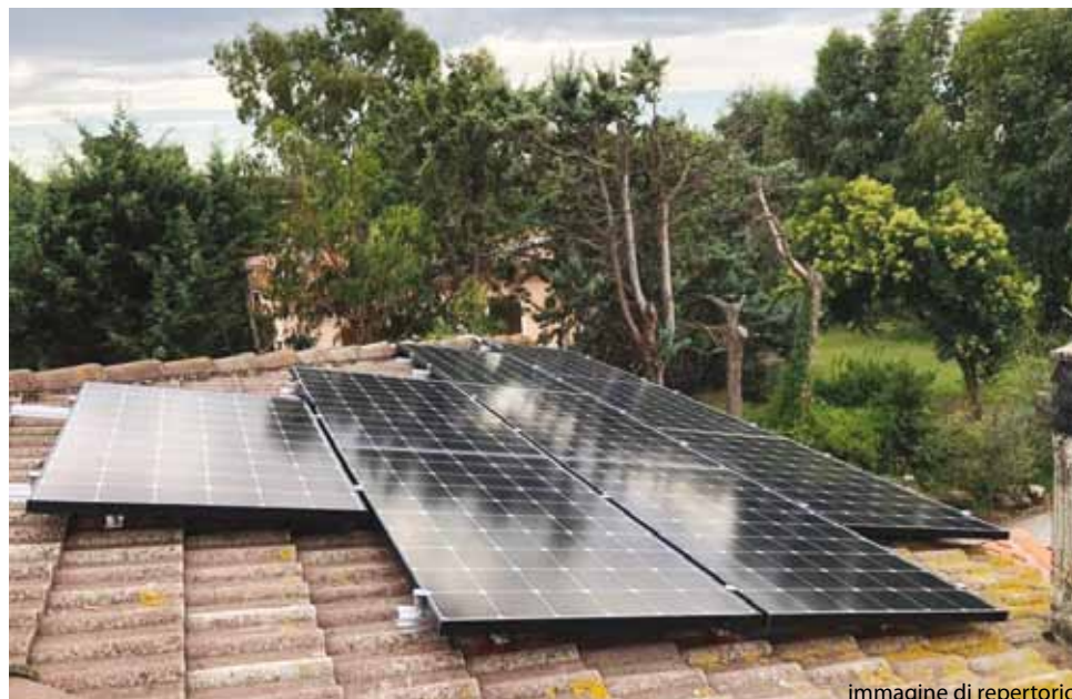
immagine di repertorio

Inutile girarci attorno: viviamo un'epoca di crisi climatica ed energetica, ma soprattutto di speculazione finanziaria che ha portato le bollette alle stelle, quindi oggi è necessario capire il tema delle alternative e in questo articolo cerchiamo di rendere tutto semplice e comprensibile. Partiamo da On grid e off grid , termini che sentiremo sempre più spesso, quindi è bene comprenderli. Per cominciare, le nostre case sono on grid : ovvero, sono allacciate attraverso fili, cavi e tubi alle varie reti nazionali di gas ed elettricità. Viceversa, una casa off the grid non è fisicamente collegata alle utenze con fili, cavi e tubi: in pratica, è completamente autosufficiente grazie ai propri impianti di energia rinnovabile. Questi impianti possono essere: eolico e/o solare fotovoltaico per la produzione di elettricità (spesso installati insieme per sfruttare sia il sole sia il vento) e solare termico o geotermico per la produzione di acqua calda sanitaria e riscaldamento .