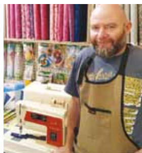
Mondoscucito Riparazione macchine da cucire e corsi cucito Chiavari Via Dante 118 Tel 0185.309703