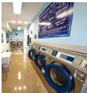
Star Wash Lavanderia a gettone (anche per animali) Carasco Via Roma 16 Tel 371.5617649