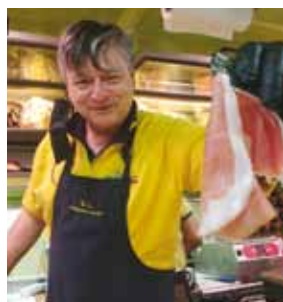
GL Garibaldi Banco di salumi e formaggi Mercati: lun Recco; mar Zo- agli e Varese L.; mer Casar- za; gio Lavagna; ven Santa M. e Deiva; dom Moneglia.