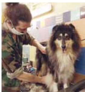
Cane e Gatto Chiavari Tutto per gli amici animali e toelettatura Chiavari Via Battisti 1 Tel 0185.325218

Da oltre 25 anni in tutte le famiglie. Sempre gratuito, grazie alle attività del territorio. Ecco dove trovate la vostra copia: