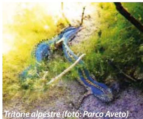
Tritone alpestre