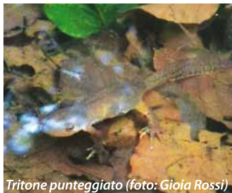
Tritone punteggiato