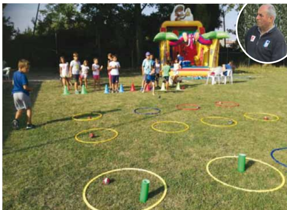
Esempi di esercizi dell'iniziativa "Bocciando si impara"