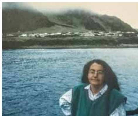
1991 - Lasciando Tristan da Cunha, su un cargo per il trasporto delle aragoste