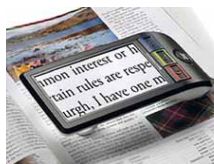
ingranditore elettronico portatile

GENOVA C.so Buenos Aires, 75r Tel. 010.3623053