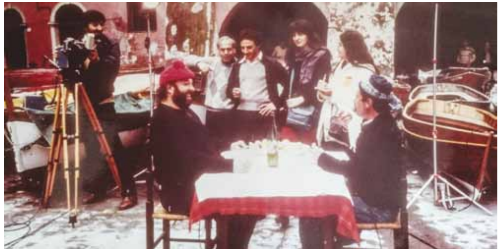
Sceneggiato Rai, "Due amici e un cane nel mare della buridda", Vernazza