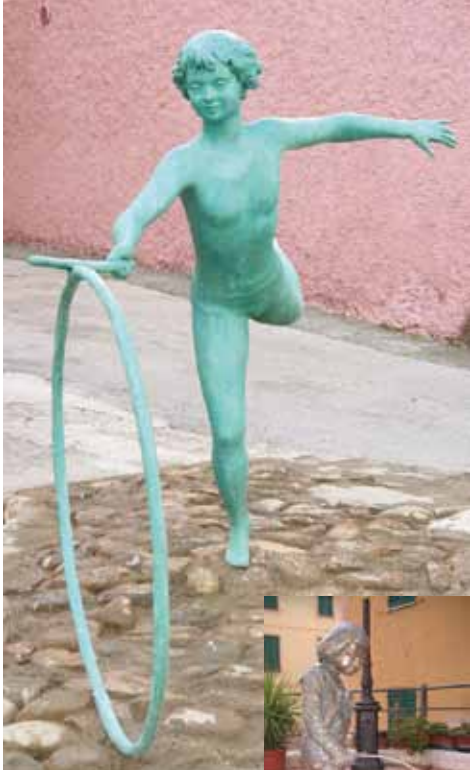
Sopra: la statua nella nuova interpretazione