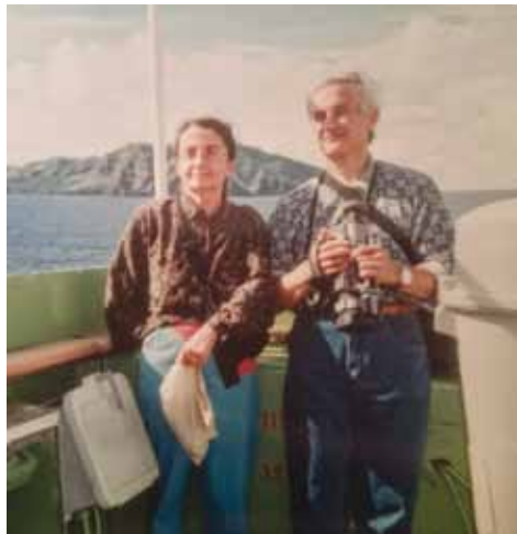
Verso l'isola degli ammutinati del Bounty