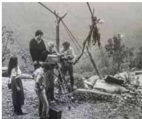
Documentario Rai sulla cava di ardesia ad Orero