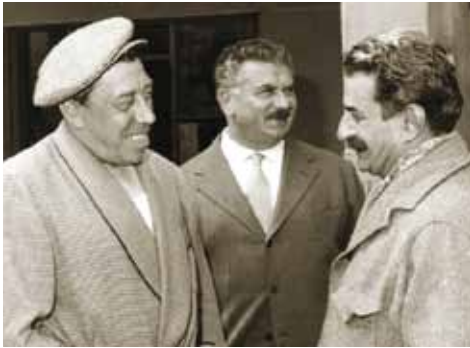
Fernandel (Don Camillo), Gino Cervi (Peppone) e Giovannino Guareschi-sul set