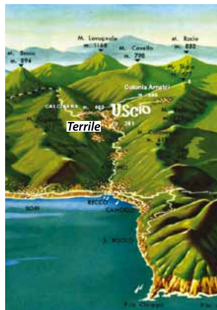
La cartina mostra il vallone tra Recco e Uscio in cui è posizionata la frazione di Terrile