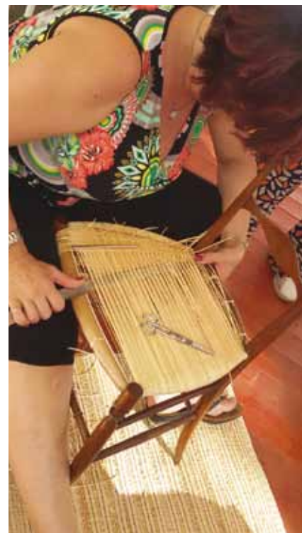
Impagliatura con attrezzi tradizionali: spada e spadino