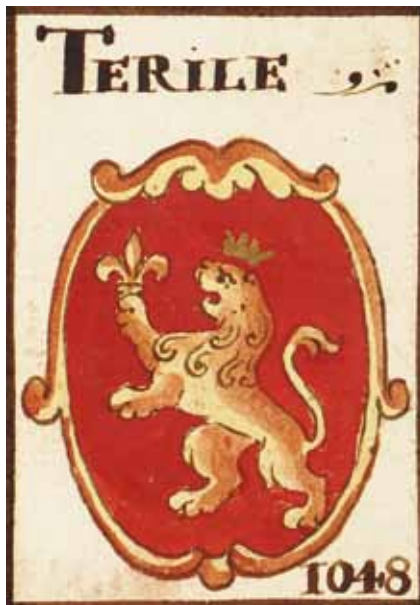
Lo stemma dei Terrile, tratto dallo Stemmario Musso conservato alla Biblioteca Berio di Genova