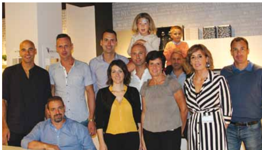
La famiglia Giuffra-De Ferrari con lo staff del nuovo centro Giuffra/Outlet Casa

Propongo quel che mi piace quindi credo in quello che vendo, puntando esclusivamente sul MADE in ITALY e al MADE in UE e anche