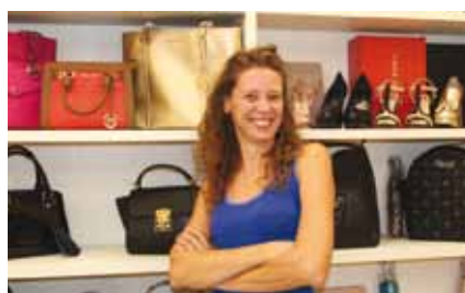
Sabrina, scarpe e borse "ScarpeDiem"