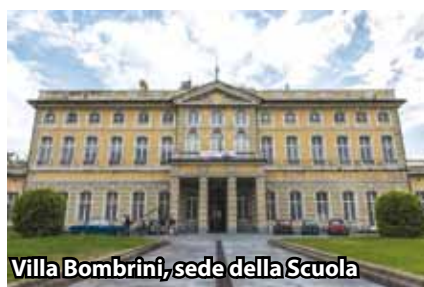
Villa Bombrini, sede della Scuola