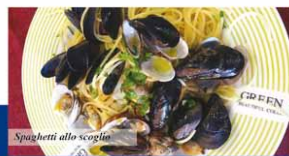
Spaghetti allo scoglio