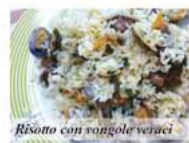
Risotto con vongole veraci