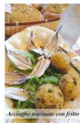
Acciughe marinate con fritto