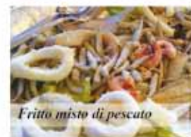
Fritto misto di pesce