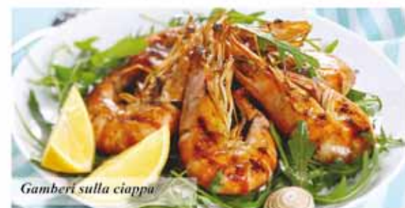
Gamberi sulla ciappa