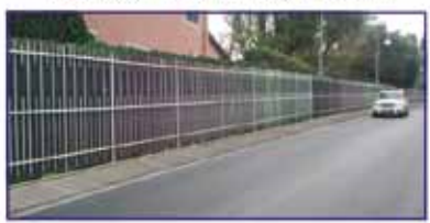
DA RAPALLO A SANTA MARGHERITA FINO A PORTOFINO UN PERCORSO PEDONALE UNICO AL MONDO.

Cioè, questa è la "passeggiata unica al mondo"? Questa è la bellezza che ci aspetta camminando per chilometri tra Rapallo e Portofino? Questo è quello che proponete a cittadini e turisti di tutto il globo? Una ringhiera?